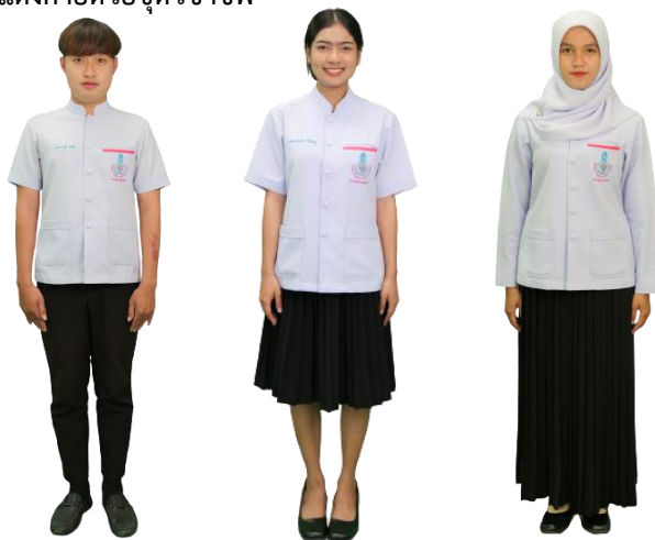
ภาพที่ 4 การแต่งกายด้วยชุดวิชาชีพ