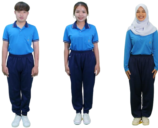
ภาพที่ 2 การแต่งกายด้วยชุดพละ