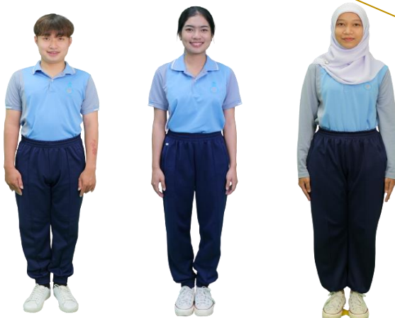
ภาพที่ 3 การแต่งกายด้วยชุดกิจกรรม