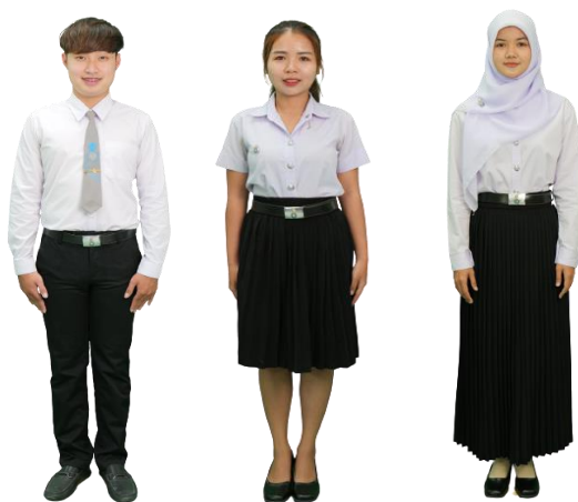
ภาพที่ 1 การแต่งกายด้วยชุดนิสิต